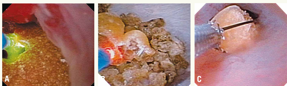
A, B: Laserlithotripsie anlässlich einer URS, C: Bergung eines grösseren Konkrements

Lithotriptoren haben zwar zur technischen Verkleinerung und einem einfacheren Einsatz dieser Geräte im Vergleich zur ersten Generation der sogenannten «Badewanne» geführt. Die Effektivität hat aber durch die technischen Veränderungen eher nachgelassen. Technische Weiterentwicklungen der vergangenen Jahre haben erneut zu einem Paradigmenwechsel in der Behandlung von Harnsteinen geführt. Bessere Optiken mit der Entwicklung feinerer, flexibler Endoskope ermöglichen heute die risikoarme Endoskopie des gesamten Harntraktes und stellen in Kombination mit der Laserlithotripsie ein Standardverfahren in der Behandlung von Nieren- und Harnleitersteinen. Bei sehr grosser Steinlast in der Niere weist die Ureterorenoskopie (URS) jedoch Limitierungen auf. In diesen Fällen kommt der minimal invasiven Steinentfernung über einen perkutanen endoskopischen Zugang (perkutane Nephrolitholapaxie, PCNL) eine wichtige Bedeutung zu (9-11).